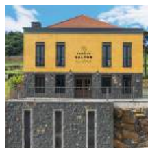
CASA DI PASTO BENTO GONÇALVES - RS