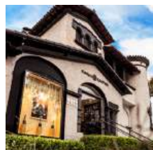
ENOTECA FAMÍLIA SALTON SÃO PAULO - SP

Continuaremos trabalhando, incessantemente, para integrar cada vez mais os aspectos da sustentabilidade à nossa estratégia, trazendo mais segurança, resiliência, integridade e responsabilidade social, ambiental e financeira para nossa empresa e para a construção de uma sociedade melhor.