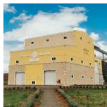
AZIENDA DOMENICO SANTANA DO LIVRAMENTO - RS