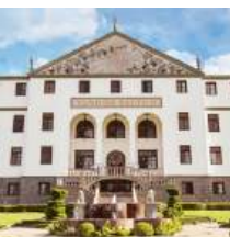
VINÍCOLA SALTON BENTO GONÇALVES - RS

No final de 2022, a nova Casa di Pasto Família Salton abre suas portas, no roteiro turístico Caminhos de Pedra, em Bento Gonçalves. Resgatando as origens dos negócios e inspirado nos ambientes da vinícola, o mais recente empreendimento turístico tem como foco a enogastronomia, combinando diferentes espaços, dentro e fora da casa, com um exclusivo menu especialmente idealizado para combinar com os espumantes e vinhos premiados ali servidos.