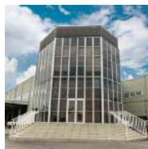
COMPLEXO PRESIDENTE JARINU - SP