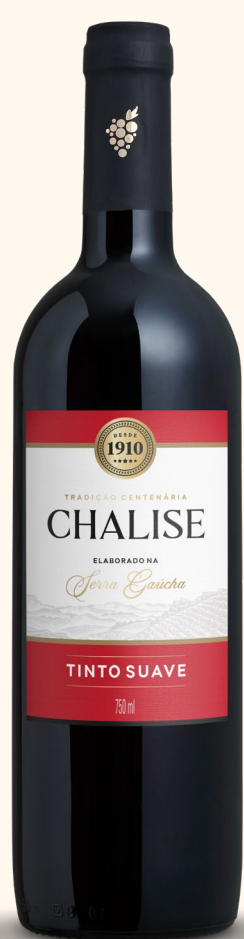
CHALISE TINTO SUAVE