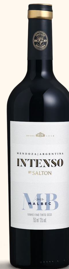
SALTON INTENSO MALBEC