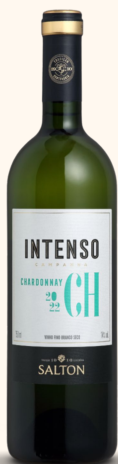
SALTON INTENSO CHARDONNAY