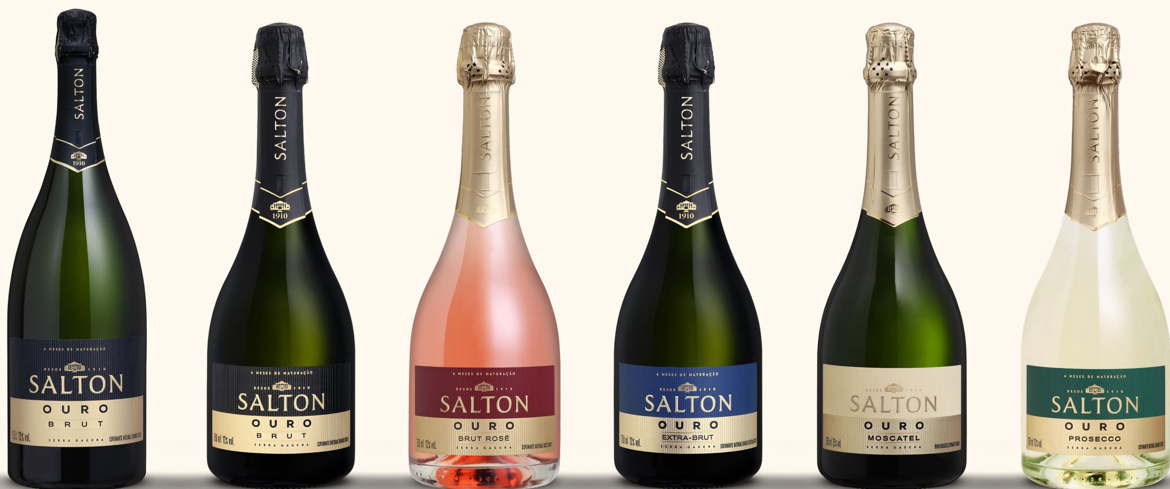
SALTON OURO BRUT 1,5L

Desfrute da excelência dos espumantes Salton Ouro, uma coleção premiada que torna qualquer momento especial. Com sabores marcantes, refrescância e muita elegância, são a escolha ideal para celebrar os momentos efervescentes da vida.