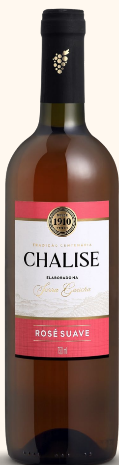
CHALISE ROSÉ SUAVE