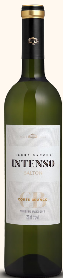
SALTON INTENSO CORTE BRANCO