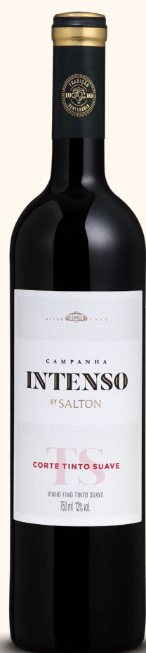
SALTON INTENSO CORTE TINTO SUAVE