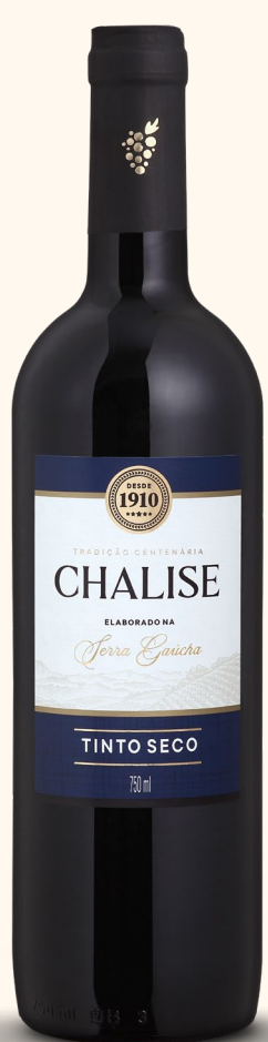
CHALISE TINTO SECO