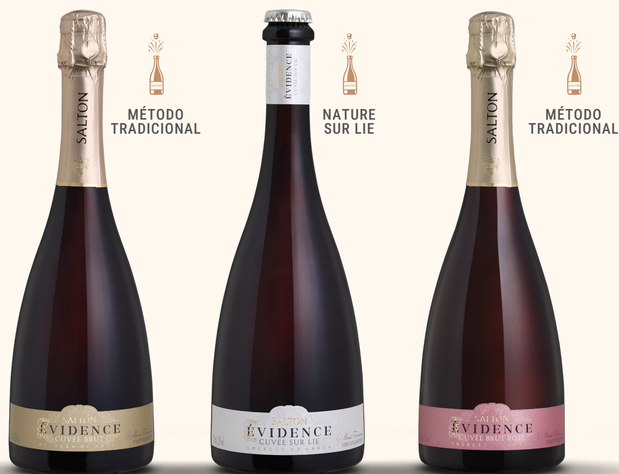
SALTON ÉVIDENCE CUVÉE BRUT

Elaborados a partir das uvas Chardonnay e Pinot Noir, pelo método tradicional e a partir de cortes e safras únicas, conjugam o frescor e a potência de uvas colhidas nas duas regiões produtoras mais importantes do país: a Serra e a Campanha Gaúcha.