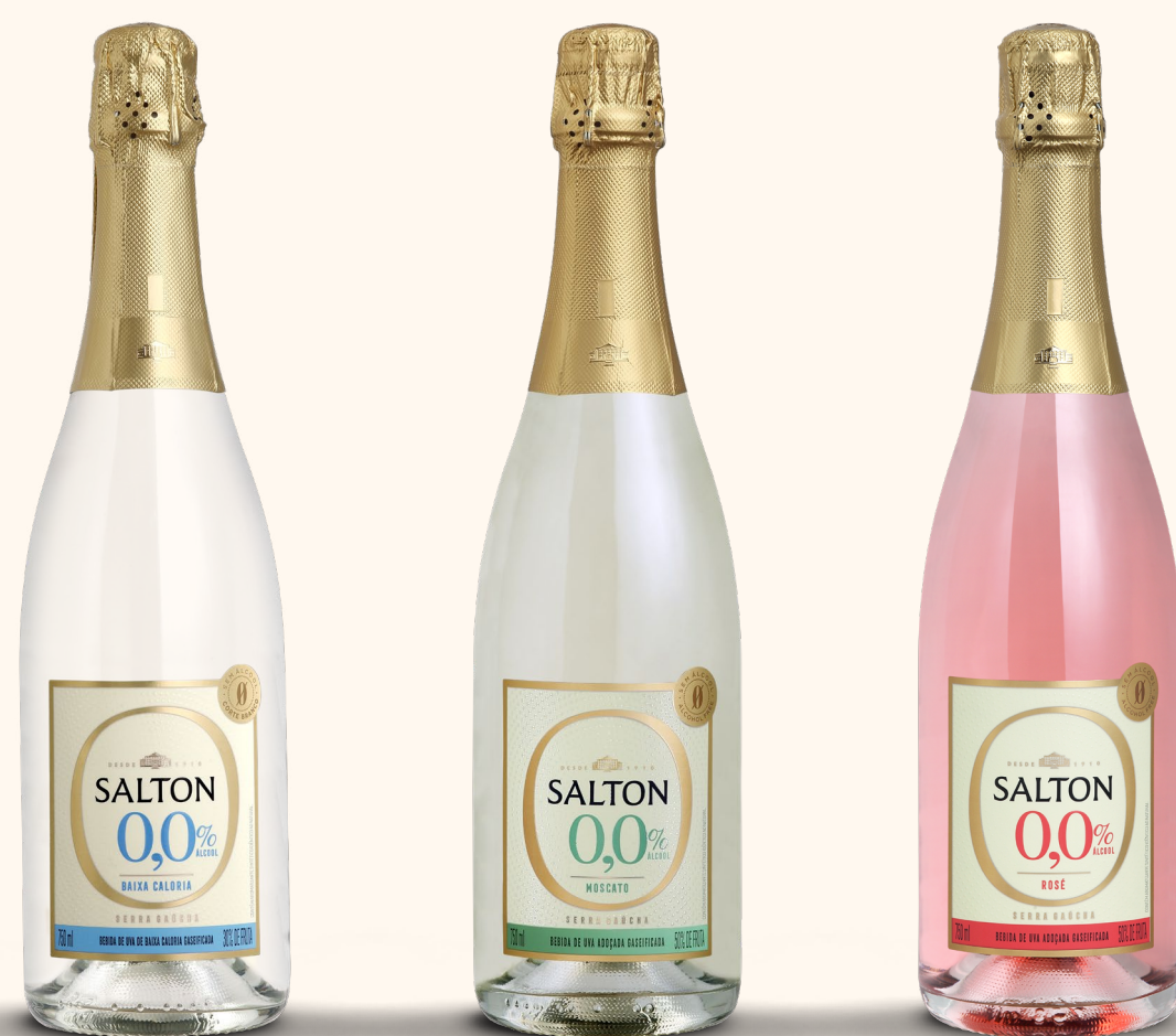
SALTON ZERO ÁLCOOL BAIXA CALORIA

Descubra o Salton Zero Álcool - a essência da celebração. É a escolha perfeita para todos os momentos, sem restrições.