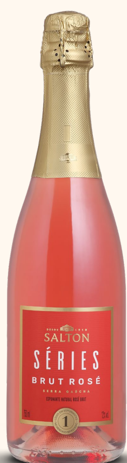
SALTON SÉRIES BRUT ROSÉ

Leveza e refrescância se combinam com delicadas notas frutadas, revelando um estilo descomplicado de apreciar a vida.