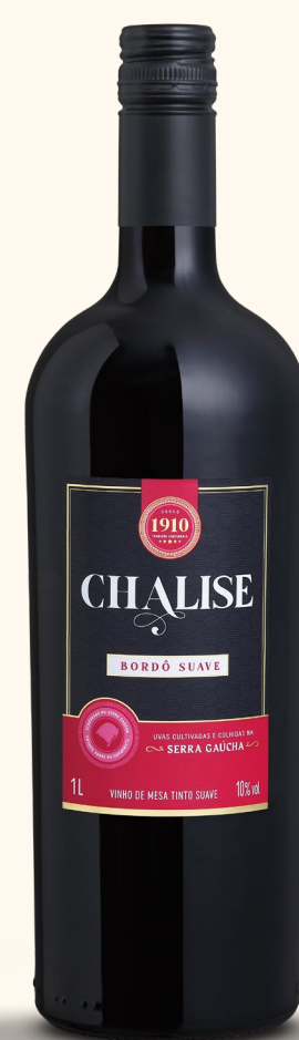
CHALISE BORDÔ SUAVE