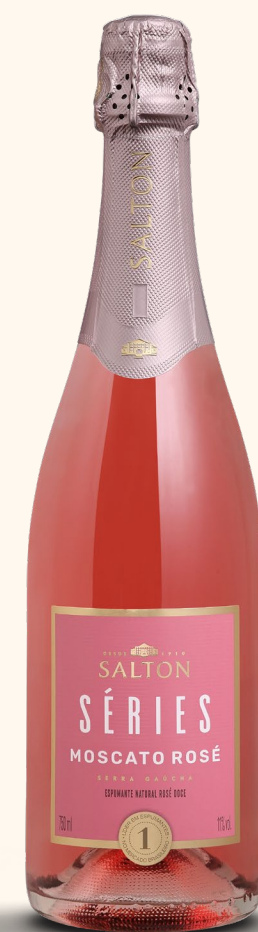
SALTON SÉRIES MOSCATO ROSÉ