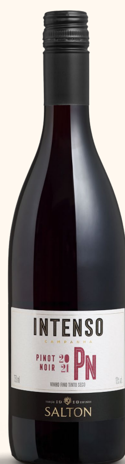
SALTON INTENSO PINOT NOIR