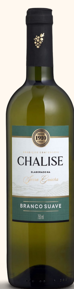
CHALISE BRANCO SUAVE