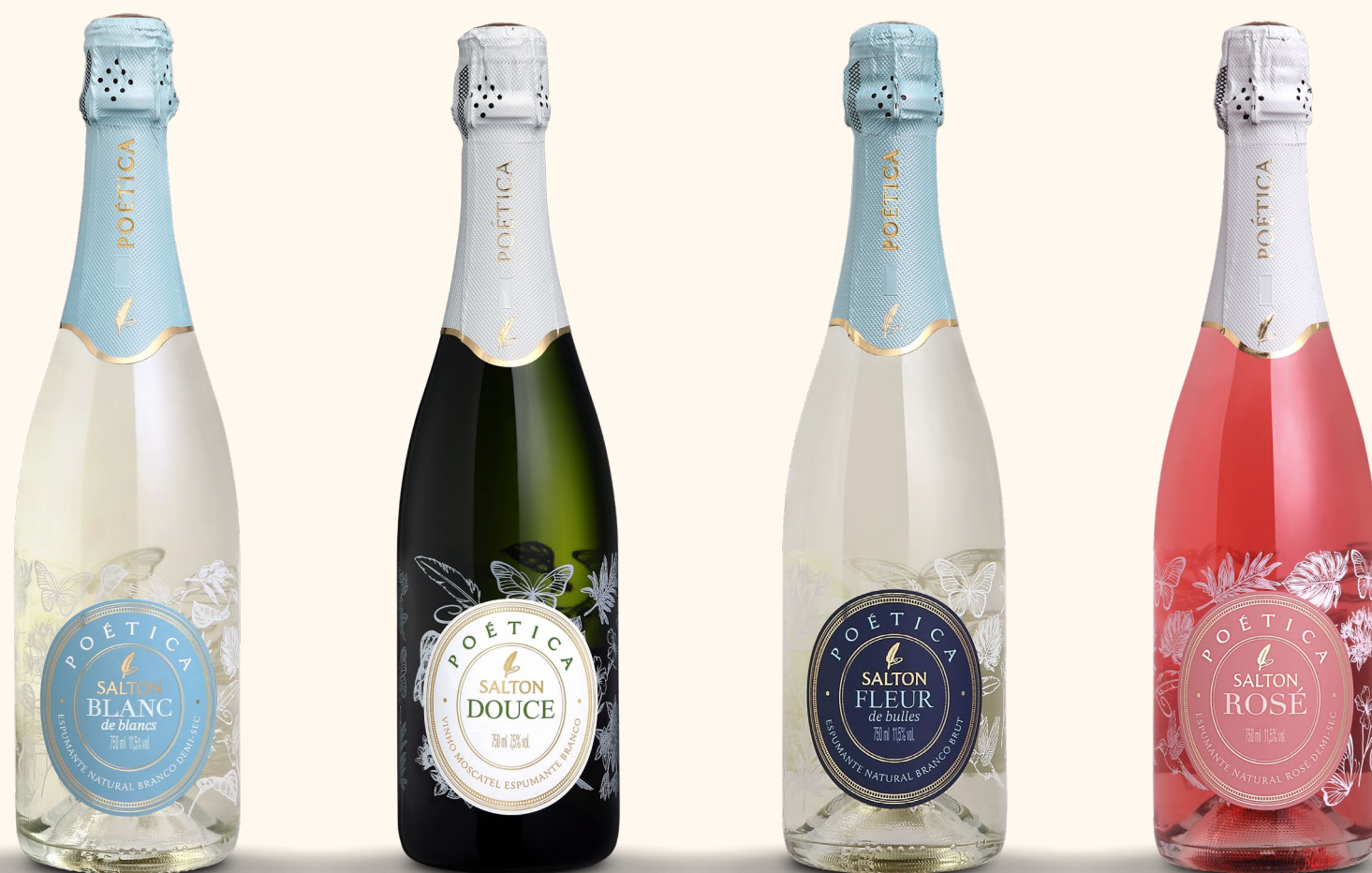
SALTON POÉTICA BLANC DE BLANCS

Os espumantes Salton Poética são perfeitos para quem busca leveza, delicadeza e efervescência em cada taça. Com sabores suaves e envolventes, refletem a elegância e a sutileza que são a essência desta linha.