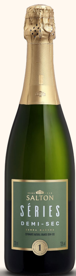
SALTON SÉRIES DEMI-SEC