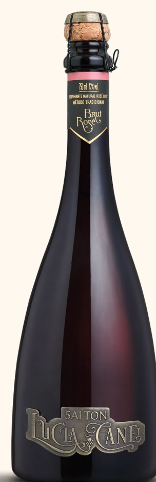
SALTON LUCIA CANEI