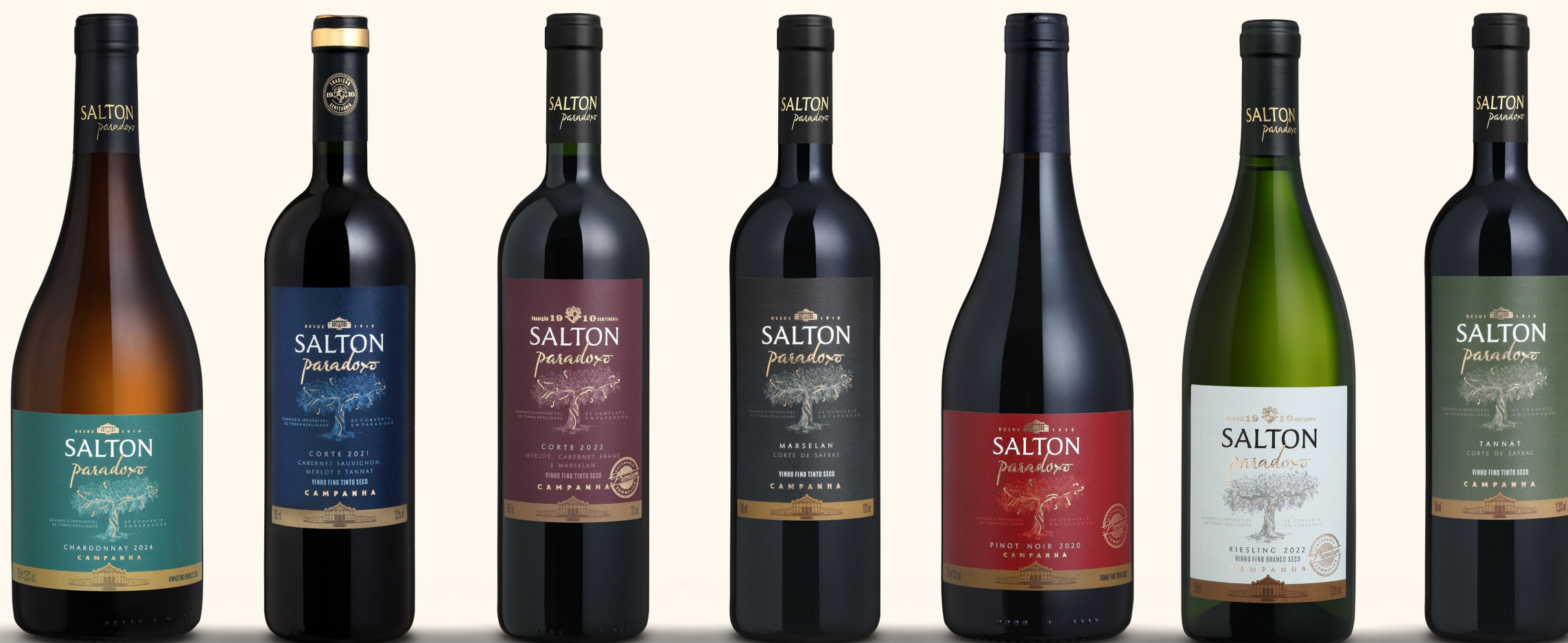
SALTON PARADOXO CHARDONNAY

É uma linha extremamente gastronômica, elaborada para que o consumidor tenha excelente experiência em toda ocasião de consumo.