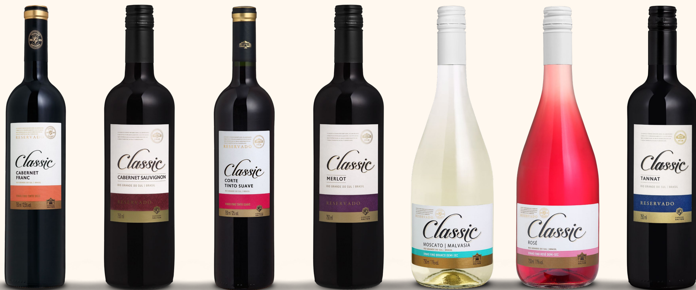
CLASSIC CABERNET FRANC