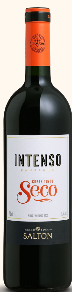
SALTON INTENSO CORTE TINTO SECO