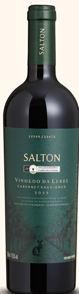
SALTON IP CAMPANHA VINHEDO DA LEBRE

Pequenos lotes que reúnem, com exclusividade, vinificações únicas de safras excepcionais, de edições e tiragens limitadas e em garrafas numeradas.