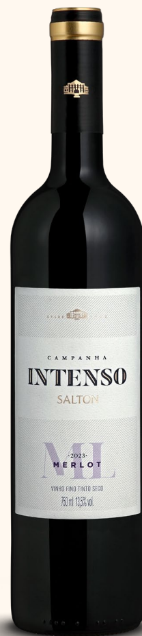
SALTON INTENSO MERLOT