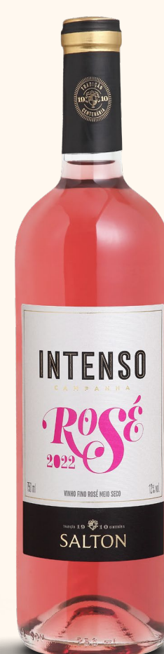
SALTON INTENSO ROSÉ