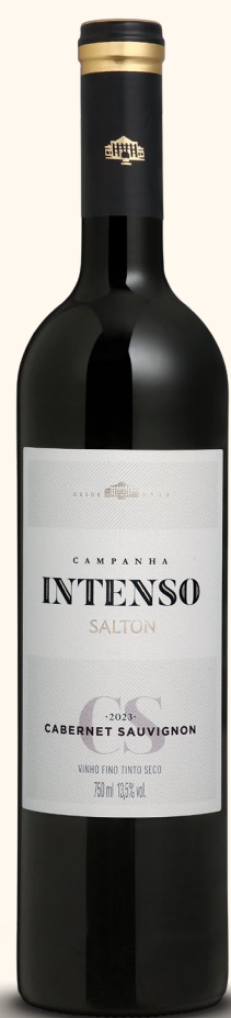
SALTON INTENSO CABERNET SAUVIGNON

As palavras-chave que definem esta linha são frescor e descomplicação. Valorizando a verdadeira expressão das variedades de uvas selecionadas, são os rótulos ideais para conhecer e se deixar envolver pelo mundo do vinho.