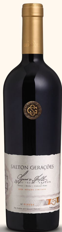
SALTON GERAÇÕES LYVIO "SILO" SALTON